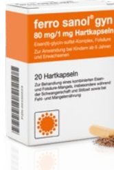
Zur gleichzeitigen Behandlung eines Folsäure-Mangels („gyn“) bzw. Verhütung eines Mangels an Vitamin B12 und Folsäure („comp“)