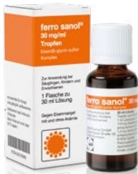
Als Tropfen geeignet z. B. bei Schluckbeschwerden